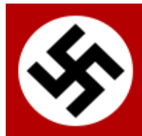
Svastica Culoarea brună

GERMANIA Führer Adolf HITLER P. NAZIST/N.S.D.A.P. Partidul Național Socialist