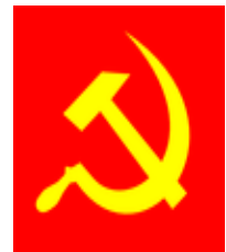
Secera și ciocanul Culoarea roșie

U.R.S.S. Secretar general VI. I. LENIN I.V. STALIN P.C.U.S. Partidul Comunist al Uniunii Sovietice